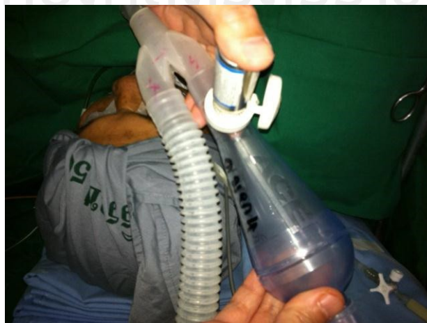
รูปที่ 3 แสดงการกดยา MDI หลังต่อเข้ากับ spacer แล้วให้กดช่วงหายใจเข้า