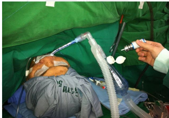
รูปที่ 2 ตำแหน่งการพ่นยาเข้า spacer