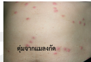
ตุ่มจากแมลงกัด

ตลอดจนอาการคันจากการแพ้สารที่สัมผัสผิวหนัง