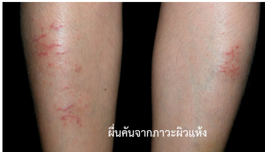
ผื่นคันจากภาวะผิวหนังแพ้

อาการคัน (Pruritus) เป็นกลุ่มอาการทางผิวหนังที่พบได้บ่อย และมักนำไปสู่การแกะเกา โดยผู้ป่วยที่มีอาการคันอาจมีผื่นผิวหนังร่วมด้วยหรือไม่ก็ได้ อาการคันอาจเป็นเพียงเฉพาะที่ หรือเป็นทั่วทั้งตัว และอาจส่งผลเสียต่อคุณภาพชีวิตของผู้ป่วยได้ เช่น ทำให้เสียสมาธิ รบกวนการทำงาน การนอน หรือ ส่งผลเสียทางด้านจิตใจ ในผู้ป่วยที่มีการแกะเกามาก อาจมีการติดเชื้อแบคทีเรียแทรกซ้อนบริเวณผิวหนังตามมาได้ด้วย