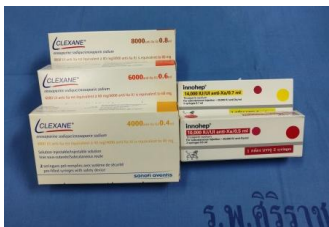
รูป ยาฉีดเฮพารินโมเลกุลต่ำสำเร็จรูป

ในปัจจุบัน การรักษาภาวะหลอดเลือดดำชั้นลึกอุดตัน สามารถให้การรักษาแบบผู้ป่วยนอกได้ด้วยการให้ยาฉีดเฮพารินโมเลกุลต่ำเข้าชั้นใต้ผิวหนัง (Low Molecular Weight Heparin : LMWH) จุดประสงค์เพื่อป้องกันการแข็งตัวของเลือด และการเกิดลิ่มเลือดใหม่ ซึ่งถือเป็นมาตรฐานการรักษาที่มีความปลอดภัยเทียบเท่าการรักษาด้วยการให้ยาเฮพารินในสารละลายทางหลอดเลือดดำ