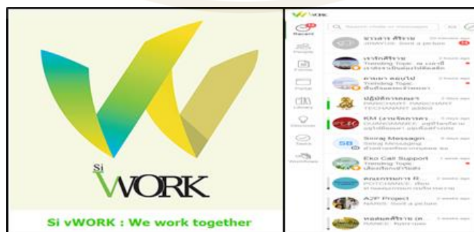
ภาพที่ 5 Application Si vWORK