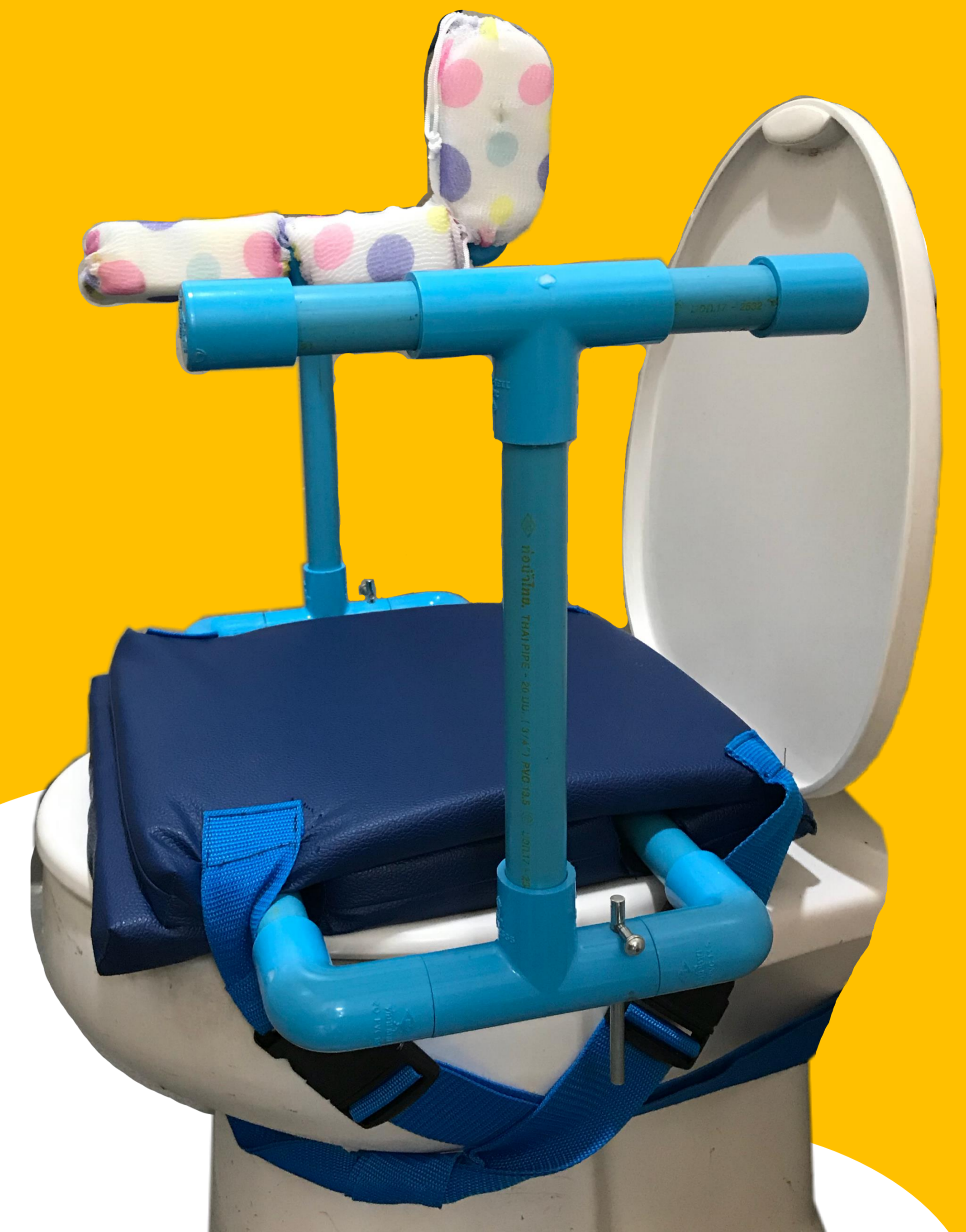
"HEMI BATH SEAT"