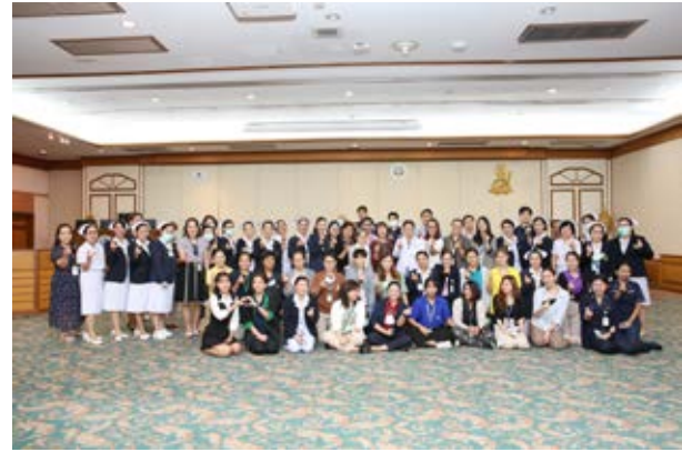
โครงการอบรมเชิงปฏิบัติการป้องกันและจัดการความรุนแรงในโรงพยาบาล Workplace Violence in Hospital Setting: Prevention & Management