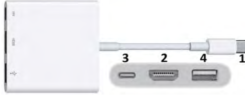
รูปที่ 2 ตัวแปลง USB-C to HDMI

เป็นตัวแปลง HDMI สำหรับ IPAD ที่มีช่องชาร์จแบบ USB-C (เช่น IPAD Air 5) เชื่อมต่อภาพและเสียงออกไปภายนอกสามารถรองรับความละเอียดของภาพสูงสุดที่ 4K 60HZ