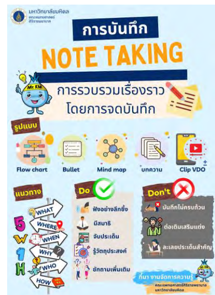
ตัวอย่าง Infographic การจดบันทึกของงานจัดการความรู้

กระบวนการคิดเป็นภาพถือเป็นทักษะที่สำคัญอย่างยิ่งต่อคนในองค์กร เพราะเป็นการพัฒนาสมองของผู้เขียน ในการจับประเด็น เชื่อมโยง และถ่ายทอดออกมาเป็นภาพ ฝึกการจัดระเบียบความคิด พัฒนาความคิดสร้างสรรค์ จุดประกายทำให้แนวคิดที่ซับซ้อนเข้าใจง่ายขึ้น เพิ่มประสิทธิภาพในการสื่อสารกับผู้อื่น และคนยังจดจำภาพได้ดีกว่าการอ่านเฉพาะ ตัวอักษร เรียกได้ว่าเป็นเครื่องมือที่สำคัญในการสร้างนวัตกรรม และนำมาประยุกต์ใช้ในการแก้ปัญหาเชิงลึกในการทำงานได้อีกด้วย