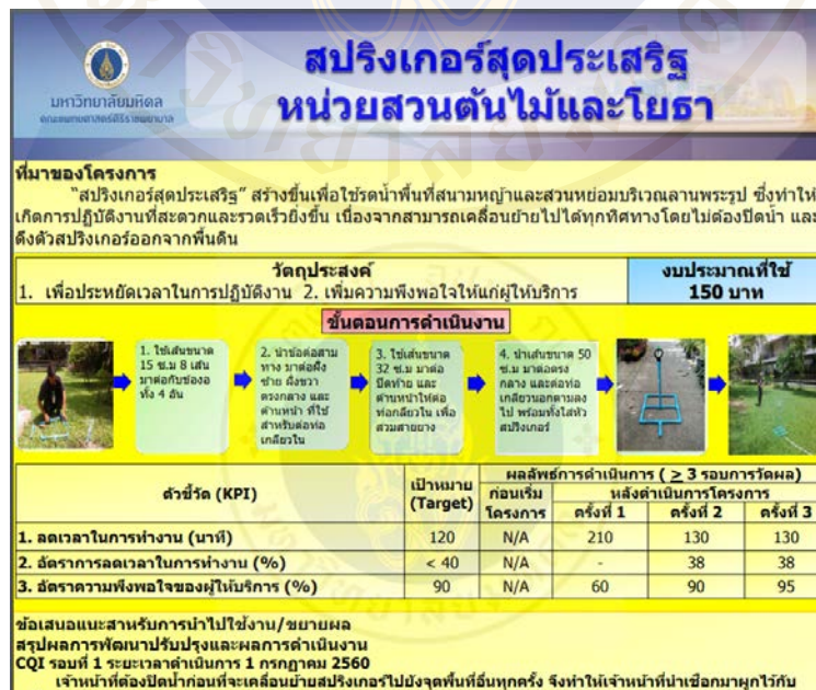
ภาพที่ 3 ตัวอย่าง Poster จากกลุ่ม CoP สวนต้นไม้และโยธา

การสรุปเนื้อหาและผลลัพธ์ โดยนำเสนอในรูปแบบ poster เพื่อให้เห็นที่มาของการดำเนินการ วิธิดำเนินการ และผลลัพธ์ อยู่ในหน้าเดียว