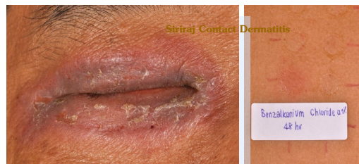
เปลือกต้อักเสบ แพ้สารกันเสียในยาหยอดตา