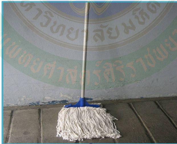
11. ไม้ผ้ามีอบพื้น