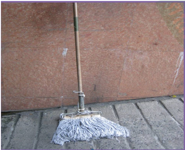
10. ไม้ผ้าชุบน้ำยาขัดพื้น