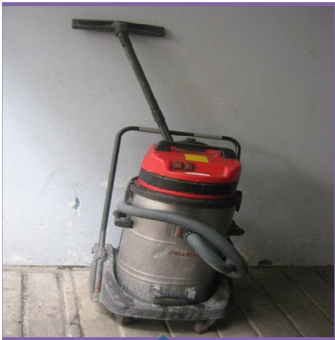
4. เครื่องดูดน้ำขนาดจุ 70-80 ลิตร