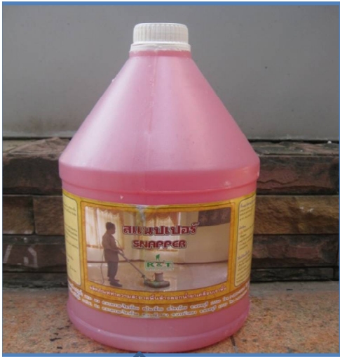
1. น้ำยาขัดพื้นลอกแว็กซ์