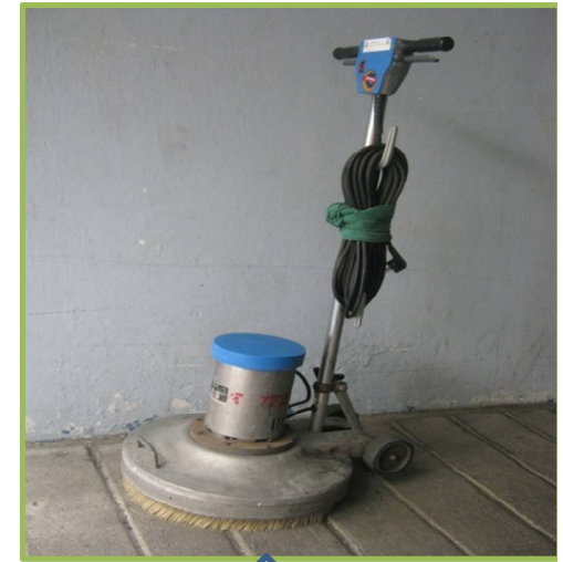
3. เครื่องขัดพื้นแบบสวิงจับสาย