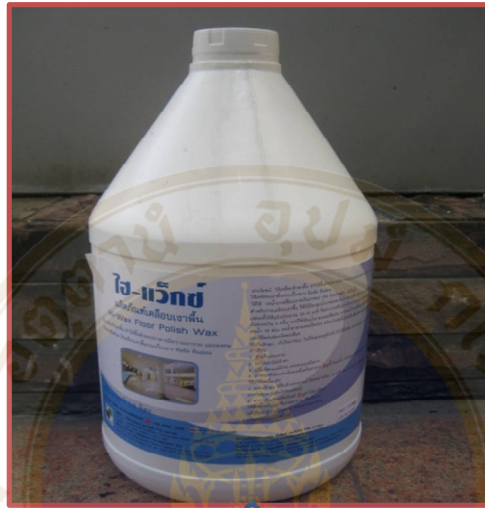
2. น้ำยาแว็กซ์เคลือบเงาพื้น