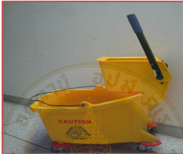
8. ถังซักบีบผ้ามีอบพื้น