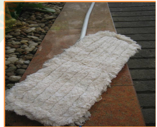
12. ไม้ผ้าลงน้ำยาเคลือบเงา