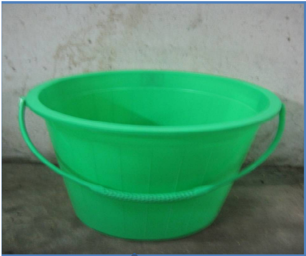
7. ถังผสมน้ำยาขัดพื้น