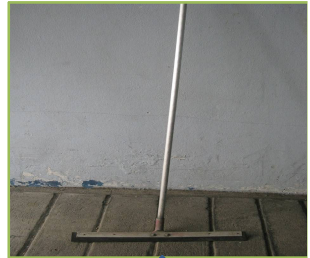
9. ไม้ยางดันน้ำ