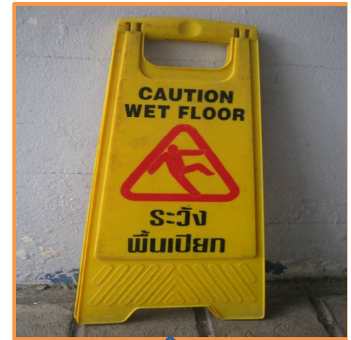
6. ป้ายบอกกันลื่นพื้นเปียก 2 อัน