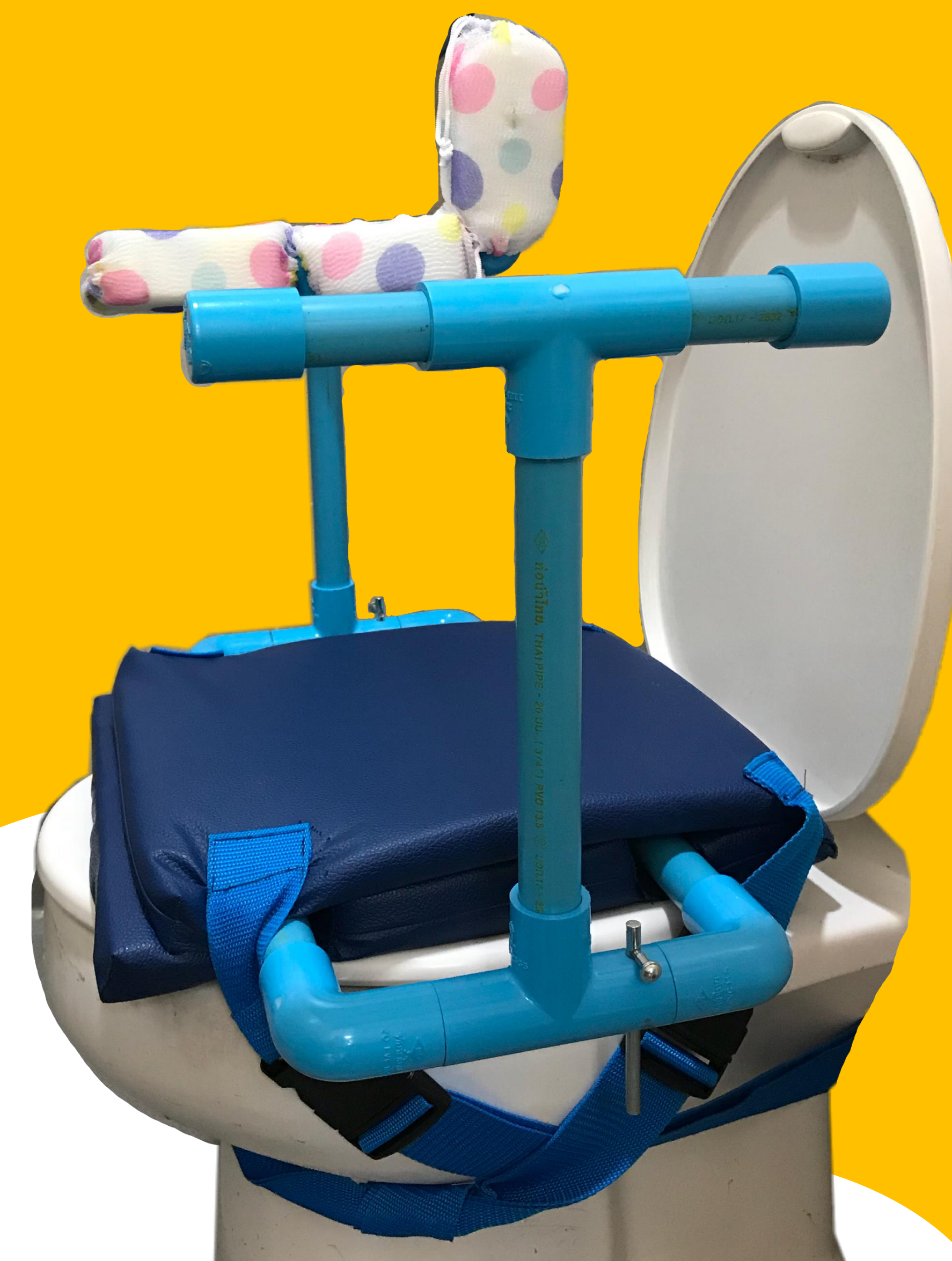
"HEMI BATH SEAT"